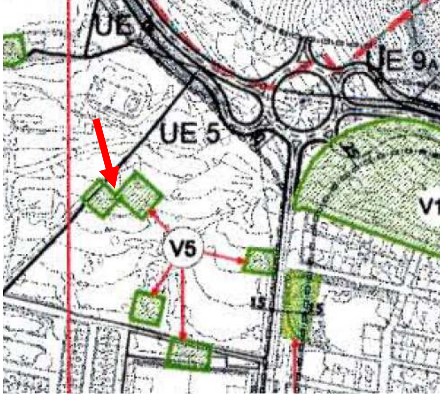
Figura 2: Ubicación de la parcela de zona verde de espacios libres de Garrucha en Almería con referencias catastral: 4347229XG0144N0000RQ .

Garrucha a fecha de firma digital. Fdo: Juan Domingo Haro Ponce. Arquitecto.